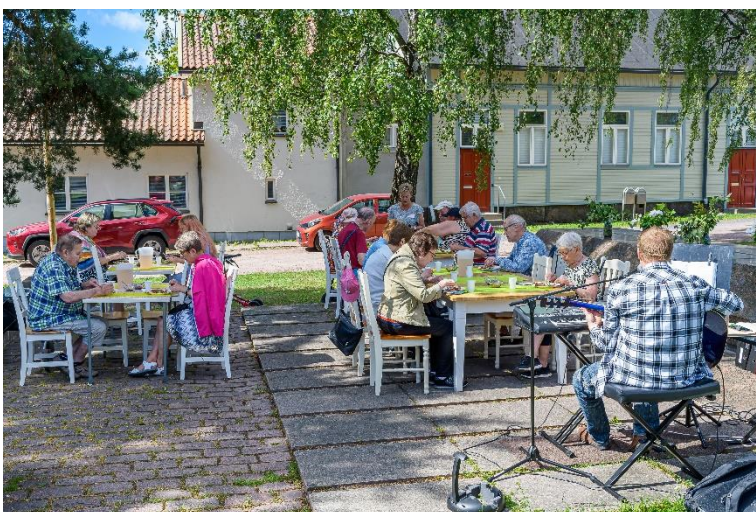
Korttelikoti Naapurin kesäjuhlat