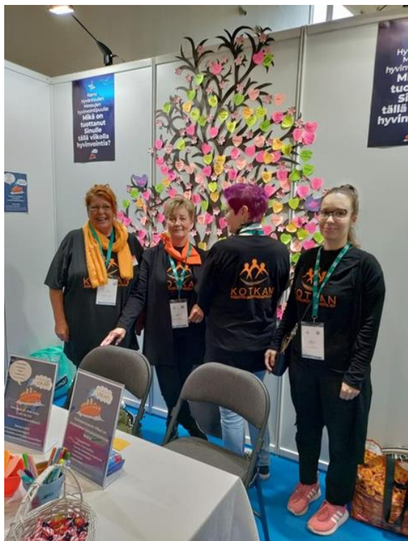
Hyvinvointi messuilla Kotkan Satama Arenalla