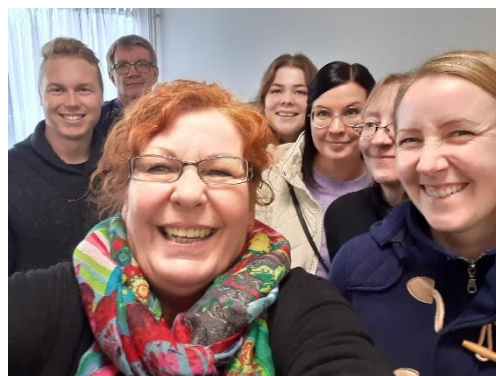
Vieraita; Taipalsaari, Rautjärvi ja Parikkala, alueiden välityömarkkinatoimijoita, kävivät tutustumassa toimintaamme